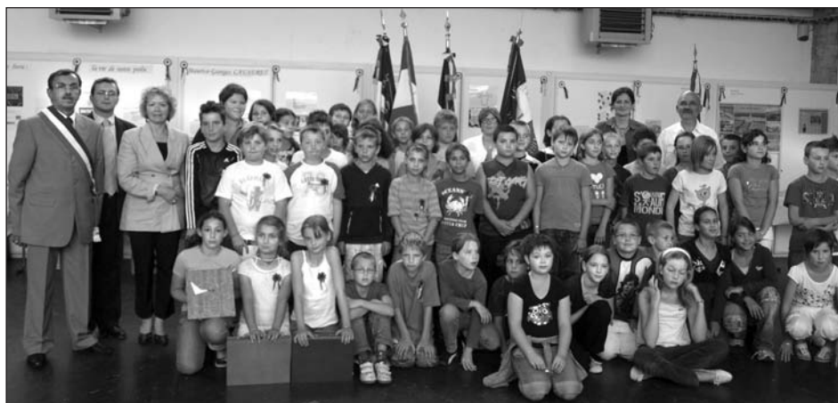
Les élèves de CM1 et CM2 d'Echenoz-la-Méline et Cerre-les-Noroy

Une participation financière de la Délégation de La France Mutualiste a permis aux élèves d'Echenoz de se rendre à VERDUN.