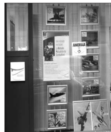
La vitrine de la délégation mise à la disposition pour l'ANORAA