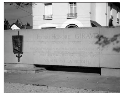
Le Mémorial Henri Giraud