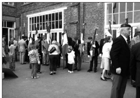
Cérémonie du 7 mai, pour le 55ème anniversaire de la fin de la bataille de Dien Bien Phu et l'hommage rendu au soldat « mort pour la France » en Indochine.