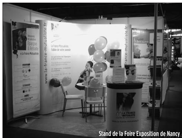
Stand de la Foire Exposition de Nancy