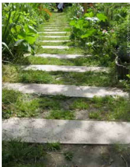
Jardin partagé de Beaugrenelle (Paris)

L es études se succèdent pour montrer combien jardiner produit un effet positif sur la santé : il favorise la forme physique, entretient les muscles, réduit les risques cardio-vasculaires, l'obésité et le diabète. Les médecins estiment, en effet, que 2h de jardinage par semaine permettent de dépenser environ 500 kcal et de diminuer sensiblement son taux de glycémie. Selon une étude anglaise*, une demi-heure hebdomadaire serait déjà très bénéfique à l'épanouissement personnel et la bonne estime de soi, en augmentant notamment le taux de sérotonine, « l'hormone du bonheur ». Une autre étude new-yorkaise** démontre qu'il améliore la vitesse de l'apprentissage tout en diminuant le niveau d'anxiété. Jardiner, c'est entrer en contact avec la terre, les racines, les saisons. C'est