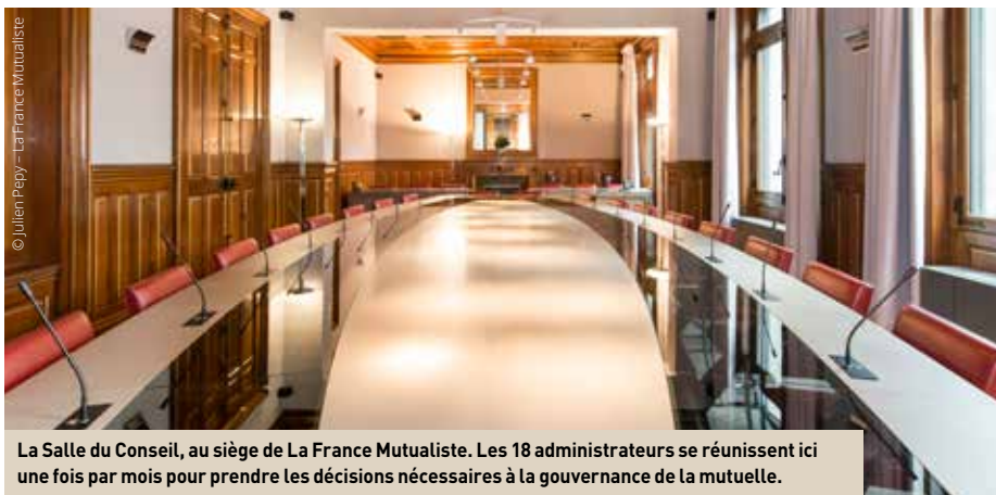
La Salle du Conseil, au siège de La France Mutualiste. Les 18 administrateurs se réunissent ici une fois par mois pour prendre les décisions nécessaires à la gouvernance de la mutuelle.

Tous les 3 ans, La France Mutualiste renouvelle la moitié des membres de son conseil d'administration. Prochaine élection le 23 juin, à l'occasion de l'assemblée générale annuelle, à Paris.