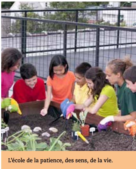
L'école de la patience, des sens, de la vie.

De nombreux établissements scolaires ont choisi de créer un jardin potager au sein même de leur établissement. L'objectif ? un apprentissage ludique et vivant, de la préservation de l'environnement à l'éducation du goût. Les élèves observent l'évolution des plantes, des fruits et légumes et participent aussi à diverses expériences visant à mettre en évidence leurs besoins : priver une plante de lumière, priver des graines d'eau, faire pousser sur des substrats (coton, cailloux...). Un programme de connaissances qui se poursuit aussi au moment de la dégustation, permettant d'aborder la question du goût, du « bien manger » et du rapport à la nourriture. Il existe même un site internet pour aider les écoles dans cette expérience.