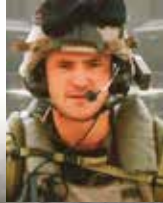
CAPITAINE THOMAS GAUVIN (27 AVRIL 1984 – 13 JUILLET 2011)