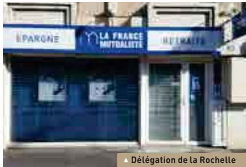
▲ Délégation de La Rochelle

Construite en deux ans seulement durant la Seconde guerre mondiale, cette base sous-marine est un immense blockhaus, destinée à abriter une flotille de la Kriegsmarine. Le bunker, qui occupe une superficie de 3,5 hectares, mesure environ 192 mètres de long, pour 165 mètres de large et 19 mètres de hauteur ; et ses murs font jusqu'à 3,5 mètres d'épaisseur ! Ce site accueille aujourd'hui un musée sur la période de la Seconde Guerre mondiale à La Rochelle.