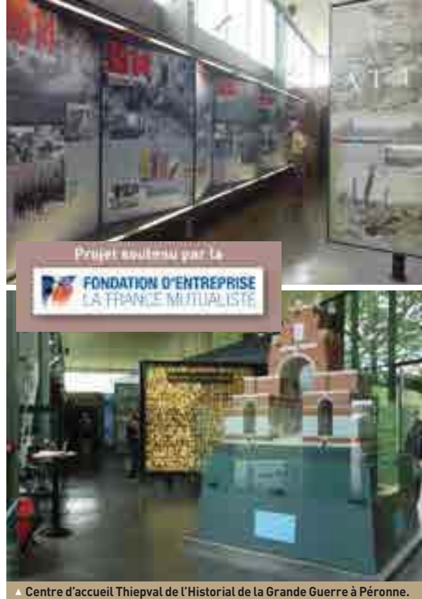
▲ Centre d'accueil Thiepval de l'Historial de la Grande Guerre à Péronne.

une histoire comparée des sociétés européennes en guerre au travers d'une mise en scène du front, du monde combattant et de la vie des civils. La diversité des objets puisés dans une collection de plus de soixante-dix mille pièces et documents originaux ainsi que « Der Krieg », les gravures emblématiques d'Otto Dix qui ont échappé à la destruction nazie... entretiennent la mémoire et participent à la compréhension de cette déflagration mondiale dans toute son ampleur et son humanité.