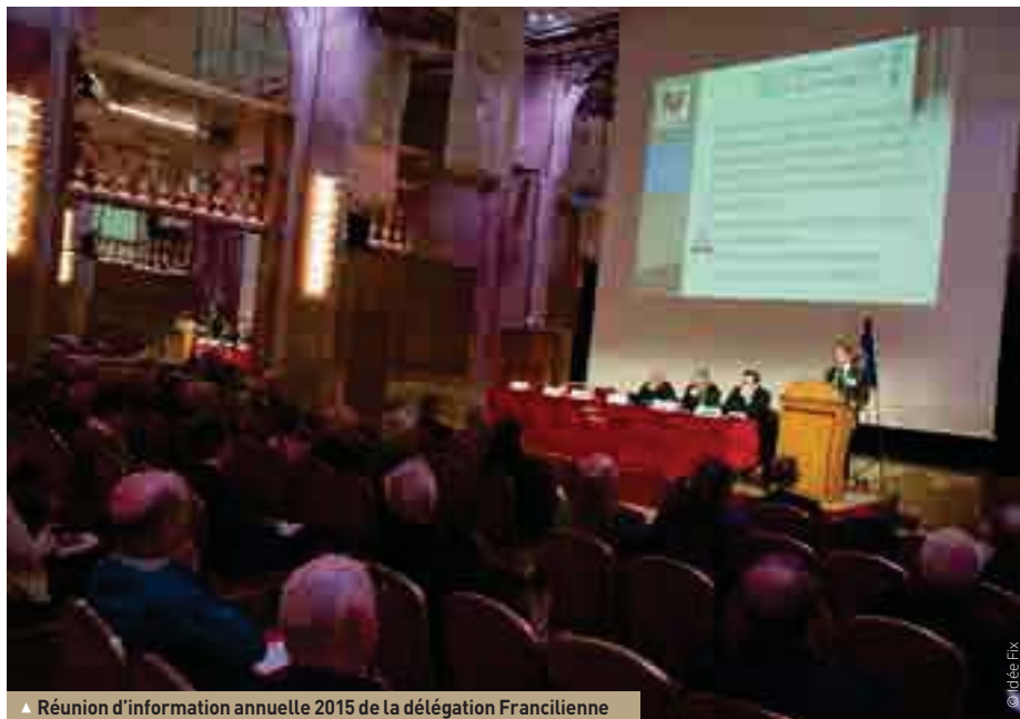
▲ Réunion d'information annuelle 2015 de la délégation Francilienne