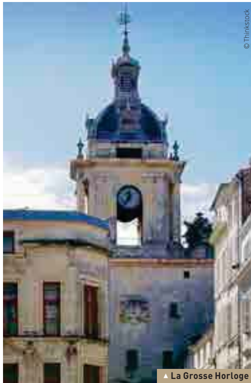
▲ La Grosse Horloge