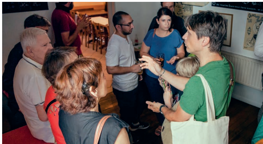
Photo prise avant l'obligation de porter un masque

capital dans les quartiers, des associations et des applications se sont développées pour créer, jour après jour, des relations de voisinage bienveillantes et de qualité.