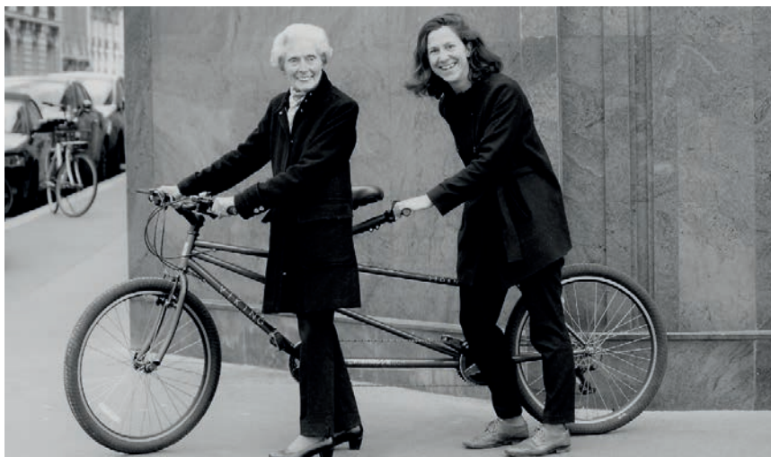
L'Echappée, une nouvelle initiative culturelle à vocation intergénérationnelle

D'un montant de 5700 euros chacune par année et par étudiant, ces bourses de vie sont attribuées aux élèves français ou étrangers qui en ont besoin. La commission d'attribution des bourses de l'École du Louvre a pour mission de sélectionner les bénéficiaires en fonction de critères de sélection précis : sociaux, résultats académiques et cohérence du parcours pédagogique. Ce mécénat - qui s'inscrit dans l'objet même de la fondation : la transmission et la mémoire - va ainsi permettre à 3 étudiants de la chaire « Patrimoine et archéologie militaires » de mener à bien leurs études et recherches.