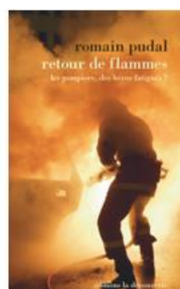
« Retour de flammes – Les pompiers, des héros fatigués ? » de Romain Pudal – éd. La Découverte