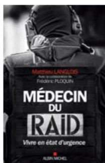
« Médecin du RAID : Vivre en état d'urgence » de Matthieu Langlois – ed. Albin Michel