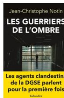
« Les guerriers de l'ombre » de Jean Christophe Notin – éd. Tallandier