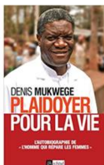
« Plaidoyer pour la vie » de Denis Mukwege – éd. L'Archipel