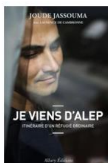
« Je viens d'Alep – Itinéraire d'un réfugié ordinaire » de Joude Jassouma et Laurence De Cambronne – éd. Allary Eds