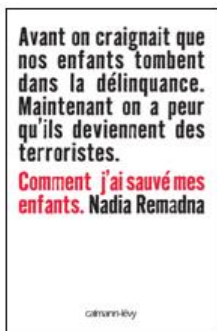
« Comment j'ai sauvé mes enfants » de Nadia Remadna – éd. Calmann – Lévy