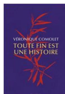
« Toute fin est une histoire » de Véronique Comolet – éd. de l'Équateur